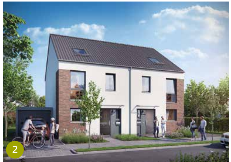
1/2/3 - Wohnformen der DORNIEDEN Generalbau/VISTA Reihenhaus. 4 - Mischung aus Einfamilienhaus- und Mehrfamilienhausbebauung in den Leidenhausener Gärten.